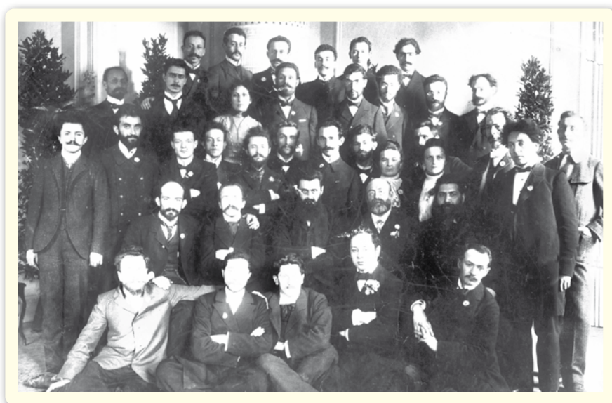
הרצל ומתנגדי תכנית אוגנדה בקונגרס השישי בבאזל. חיים וייצמן יושב ראשון משמאל בשורה השנייה; באזל, שוויץ, 1903.

בקיסרות הרוסית: בשנה בה פרץ משבר אוגנדה, פרץ פוגרום נוסף שפגע ביהודי הקיסרות הרוסית (פוגרום קישינב). הרצל טען שיש לבחון את הטריטוריה המוצעת באוגנדה כאמצעי להגנה על יהודי הקיסרות הרוסית מפני פרעות נוספות. הוא הציע לראות באוגנדה פתרון זמני ליהודי הקיסרות הרוסית, "פת לחם [לרעב]" עד שאפשר יהיה לקבל צ'רטר לארץ ישראל (נורדאו), תומכו ומקורבו של הרצל, הציע לראות בתכנית אוגנדה מקלט לילה זמני). עמדה זו נבעה מתפיסתו של הרצל את האיום הפיזי כאיום המשמעותי ביותר על העם היהודי.