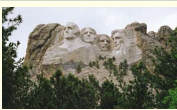
פסל חקוק בסלע ובו מנהיגי האומה האמריקאית;

הר רשמור, דרום דקוטה, ארה"ב, 1996. (אריה יובל)