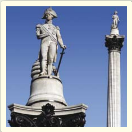
פסלו של הורשיו נלסון

גיבור לאומי בריטי; כיכר טרפלגר, לונדון, בריטניה.