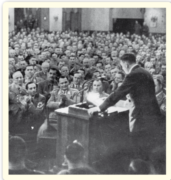
היטלר נואם בפני חברי המפלגה הנאצית;

בניגוד לציפיותיו המוקדמות של היטלר, תהליך שיקום המפלגה הנאצית לא היה קצר. השיפור שחל במצבה הכלכלי של גרמניה בשנים אלה הפחית את העוינות הכללית לרפובליקת ויימר ופגע בכוכנות הציבור לאמץ את מסריו האנטי-