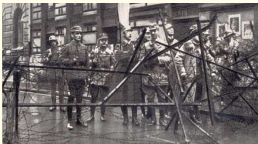
אנשי המפלגה הנאצית ניצבים מאחורי בריקדות במהלך הפוטש במרתף הבירה; מינכן, גרמניה, 1923

ממעשי הרצח בוצעו בידי הימין ו-22 בידי השמאל). על שבעה-עשר מתוך הרוצחים מהשמאל הוטלו עונשים כבדים, בהם עשר הוצאות להורג, ואילו 326 מהרוצחים מהימין לא נענשו כלל. ממוצע העונשים שהוטלו על אנשי השמאל היה עשר שנות מאסר, לעומת ארבעה חודשי מאסר בממוצע שהוטלו על אנשי הימין 41 . נטייה זו באה לידי ביטוי גם בעונש הקל שהוטל על אדולף היטלר, מנהיג המפלגה הנאצית, לאחר שניסה להפיל את המשטר הדמוקרטי באמצעות הפיכה ב-1923 ( הפוטש במרתף הבירה ). בעקבות ניסיון הפיכה זה הועמד היטלר לדין באשמת בגידה. השופטים מצאו אותו אשם ודנו אותו לחמש שנות מאסר בתנאים נוחים. בפועל ישב היטלר במאסר תשעה חודשים בלבד, בשל ההתנהגות הטובה שהפגין בכלא.