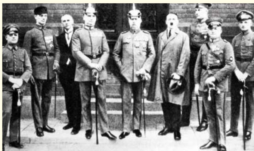
הנאשמים במשפט שנערך בעקבות הפוטש במרתף הבירה; מינכן, גרמניה, 1924 (יד ושם)